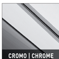
CROMO | CHROME