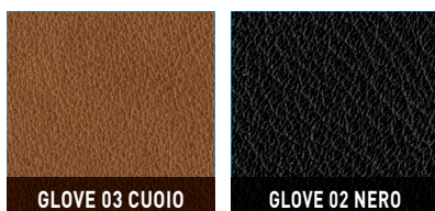
GLOVE 03 CUOIO